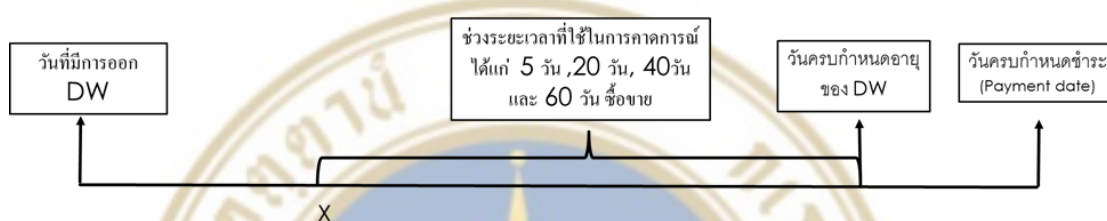
รูปภาพที่ 4.3 แสดงช่วงระยะเวลาที่ใช้ในการเก็บข้อมูลเพื่อคำนวณค่าของความผันผวนแฝง

สำหรับการนับวันเพื่อใช้ในการเก็บข้อมูลสำหรับการหาค่าความผันผวนแฝงนั้น จะเริ่มนับจากวันครบกำหนดอายุของ DW (Maturity date) ย้อนหลังมาเท่ากับระยะเวลาที่ใช้ทำการทดสอบการคาดการณ์ ยกตัวอย่างเช่น ถ้าทดสอบความสามารถในการคาดการณ์สำหรับช่วงระยะเวลา 5 วันทำการซื้อขาย ก็นับจากวันซื้อขายวันสุดท้ายของ DW ย้อนหลังมา 5 วันทำการซื้อขาย แสดงในรูปภาพที่ 4.3