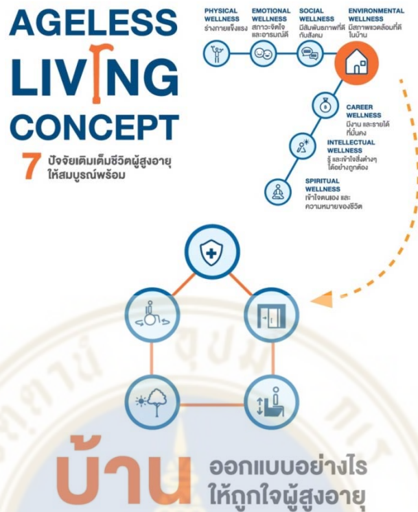
ภาพที่ 2.1 แนวคิดเรื่อง 7 ปัจจัยเติมเต็มชีวิตผู้สูงอายุให้สมบูรณ์แบบ