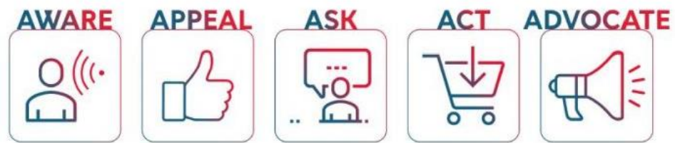
กลยุทธ์ 5A ของ Phillip Kotler จาก Marketing 4.0