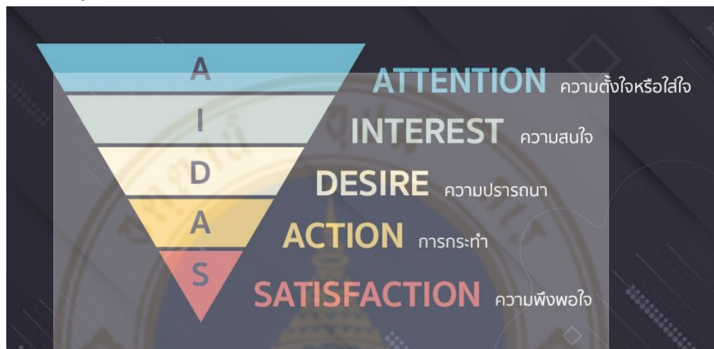
ภาพที่ 4.2 AIDA Model

นของพวกเขาเสมอ เพราะพวกเขาต้องการที่จะมองดูจิ้งมีกิจกรรมร่วมกัน ไม่ได้ต้องการให้มาอยู่ใกล้พวกเขา ดังนั้นทฤษฎีที่เกี่ยวข้องดังกล่าวค่อนข้างเป็นเรื่องจริงและตรงตามพฤติกรรมของสาววายเป็นอย่างมาก รวมถึงเมื่อเขาเห็นว่าจิ้งเป็นฟรีเซ็นเตอร์สินค้าก็สามารถดึงดูดความสนใจของพวกเขาได้ในทันที เป็นการทำการตลาดกับสาววายได้อย่างแนบเนียน นอกจากจะตรงตามแนวคิดทฤษฎี Communication Strategy ในวิชา Strategic Marketing Management ใน AIDA Model (ทฤษฎีการสร้างแรงจูงใจแบบดั้งเดิม) ดังนี้