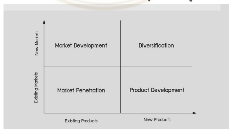
ภาพที่ 4.3 AnSoff's Model

AnSoff's Model คือ การหาโอกาสเติบโตจากธุรกิจที่เป็นอยู่ และวิเคราะห์ที่ได้ดังนี้