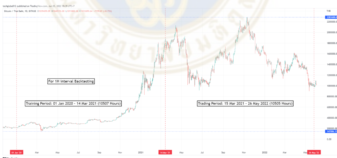
ภาพที่ 2 : แสดงราคารายชั่วโมง (1H) (หน่วย:บาท) ของ BTCTHB ของศูนย์ซื้อขายสินทรัพย์ดิจิทัล Bitkub ระหว่างวันที่ 1 ม.ค. 2563 – 26 พ.ค. 2565

Training Period คือช่วง 1 ม.ค. 2563 – 14 มี.ค. 2564 และ Trading Period คือช่วง 15 มี.ค. 2564 – 26 พ.ค. 2565