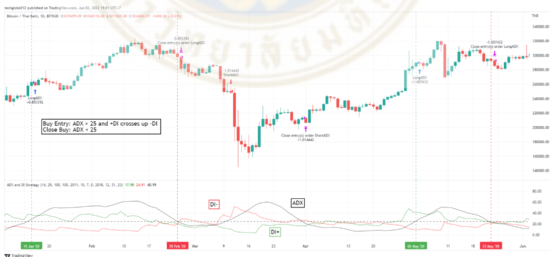
ภาพที่ 4 : เครื่องมือ ADX + DMI และตัวอย่างสัญญาณการซื้อขายโดยเครื่องมือ

สัญญาณขาย: เมื่อ ADX < 25 หรือ +DI < -DI