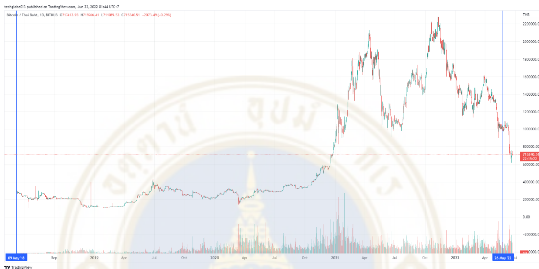
ภาพที่ 1 :แสดงราคา (หน่วย:บาท) ของ BTC/THB และปริมาณการซื้อขายบิทคอยน์ (หน่วย:BTC) ของศูนย์ซื้อขายสินทรัพย์ดิจิทัล Bitkub ระหว่างวันที่ 9 พ.ค. 2561 ถึงวันที่ 26 พ.ค. 2565 (ภาพจาก Tradingview)

ยิ่งขึ้น ทำให้นักลงทุนเข้าสู่ตลาดซื้อขายสกุลเงินดิจิทัลเพิ่มขึ้นถึง 10 เท่าในปี 2564 เมื่อเทียบกับปี 2563 จากข้อมูลของศูนย์ซื้อขายสินทรัพย์ดิจิทัล บริษัท บิทคับ ออนไลน์ จำกัด (BITKUB) มีปริมาณการซื้อขายโดยเฉลี่ยต่อวันมากถึง 4 พันล้านบาทในปี 2021 อ้างอิงข้อมูลจาก Stelareum, 2022