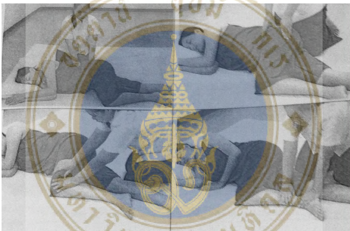
ภาพที่ 4 แสดงการนวดผู้หญิงตั้งครรภ์

คุณแม่ตั้งครรภ์นอนบนฟูกที่ไม่มีความสูง ใช้เทคนิคการนวดสัมผัสโดยหลีกเลี่ยงการตัดและดึงตัวรวมถึงหลีกเลี่ยงการกดจุดสะท้อนที่ฝ่าเท้า เพราะอาจทำให้เกิดอันตรายต่อคุณแม่และเด็กในครรภ์ได้ โดยมุ่งเน้นไปที่การนวดกระตุ้นระบบไหลเวียนโลหิตซึ่งช่วยแก้อาการปวดเมื่อยตามบริเวณต่างๆ เนื่องจากน้ำหนักตัวของคุณแม่ตั้งครรภ์ที่เพิ่มขึ้นอย่างรวดเร็ว การนวดสปาสามารถช่วยบรรเทาอาการปวดเหล่านี้ได้ โดยการนวดในท่านอนตะแคง เน้นจุดนวดที่แก้อาการปวดหลังและปวดขาตามภาพ